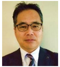
熊本県農林水産部農村振興局