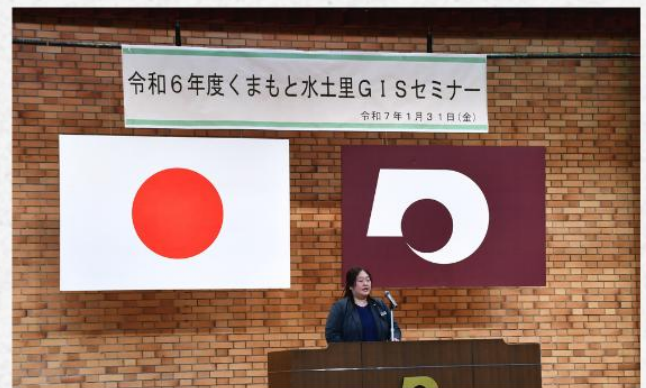
開会の挨拶（西 協議会事務局）

加えて、新システムでのデータの共有化に向けたサーバーの設置・オンライン化に必要なネットワーク環境の構築も進めています。