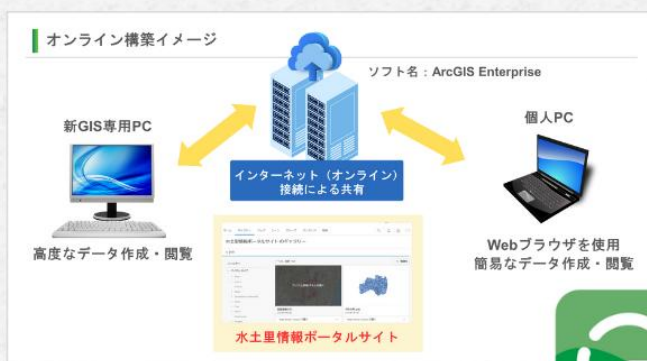
▲ オンライン構築イメージ

新システムでは、農業水利施設の戦略的保管理や柔軟な水管理の実現、災害発生時の活用、施策立案のサポートなど、地域全体の課題解決や効率的な資源管理に貢献することが期待されます。