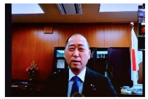
宮崎雅夫参議院議員によるWEB挨拶