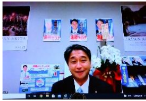
進藤金日子参議院議員によるWEB挨拶